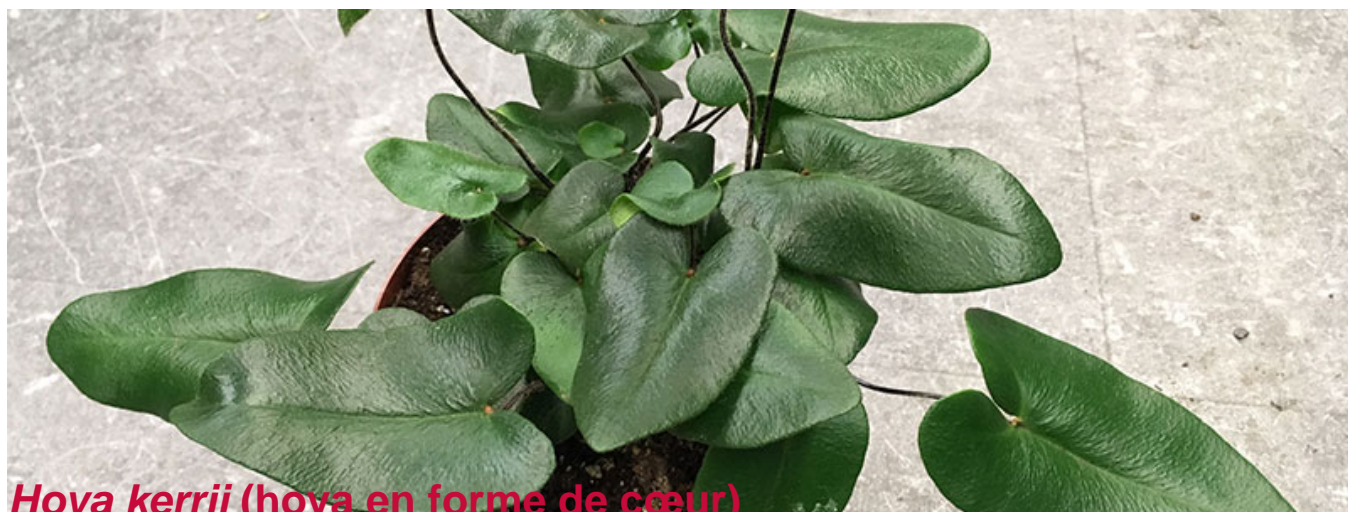
Hoya kerrii (hoya en forme de cœur)

dose d'engrais de moitié pour un bon résultat. À essayer pour les amateurs de défis!