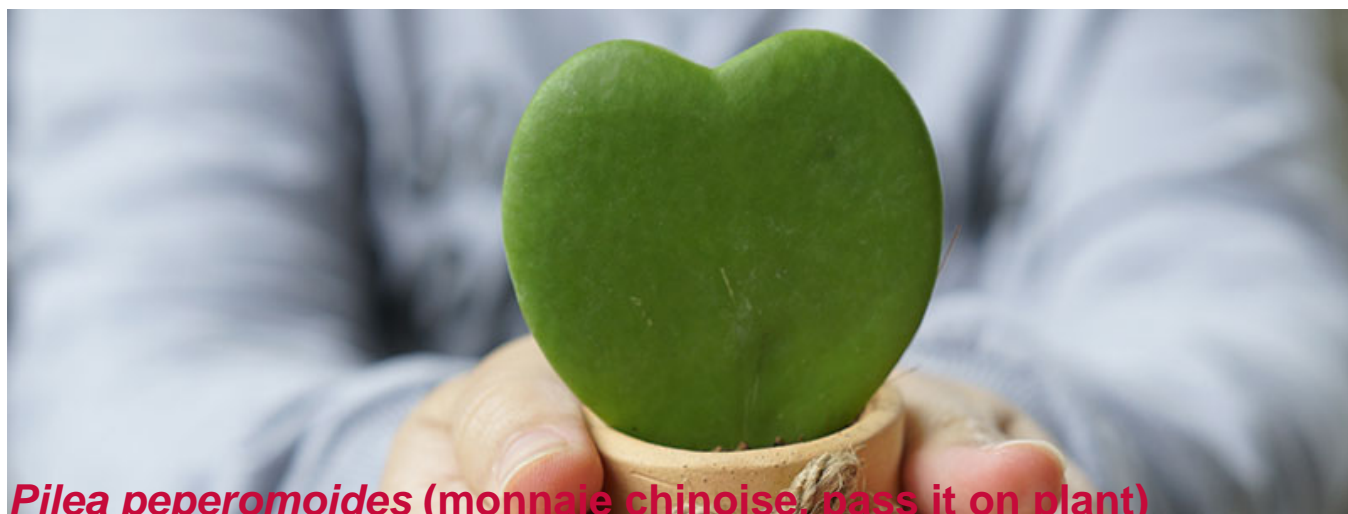
Pilea peperomoides (monnaie chinoise, pass it on plant)

Il faut parfois chercher pour trouver cette plante vraiment mignonne! Offerte plus souvent en très petit pot présentant seulement une feuille, très charnue, en forme de cœur. L'effet est des plus jolis dans un cache-pot. Plante de croissance plutôt lente, elle peut rester au stade d'une seule feuille pendant une ou deux années avant de se décider à pousser. Tous les hoyas demandent un éclairage intense pour croître de façon optimale et pour espérer fleurir un jour. Le terreau doit sécher légèrement entre les arrosages et surtout ne pas demeurer humide. Une fertilisation une fois par mois avec un engrais de type 20-8-20 est idéale pour ce type de plante.