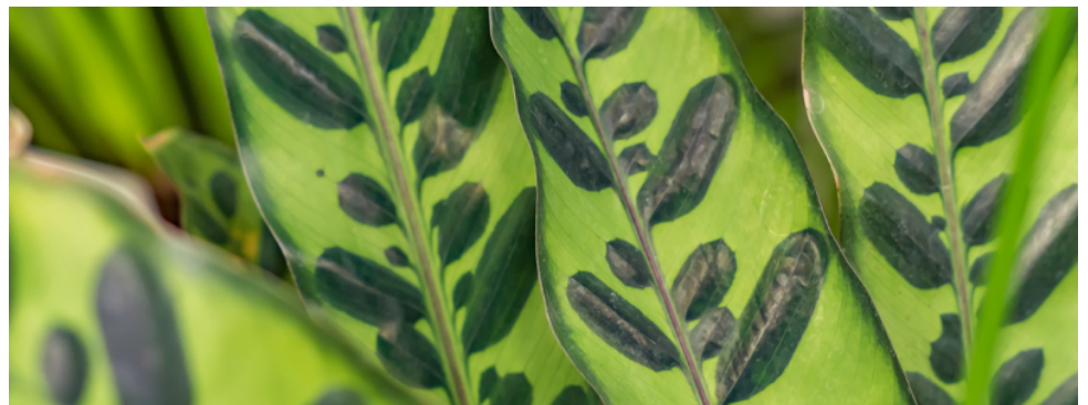
Calathea lancifolia (Rattle Snake)