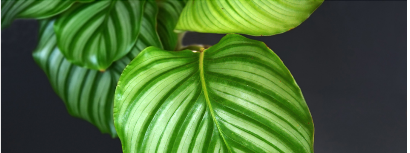
Calathea 'White Fusion'

Si vous réussissez à le trouver en jardinerie, vous craquerez pour son feuillage présentant beaucoup de blanc.