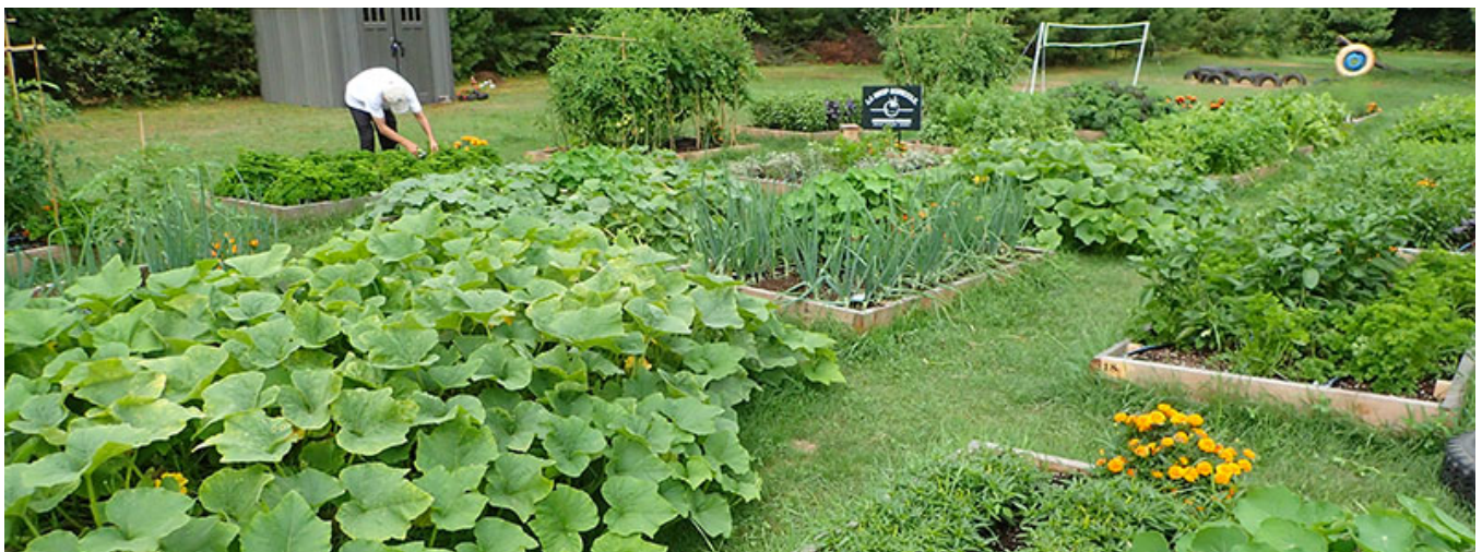
Un potager en carré typique en bois.

Si vous voulez récolter des légumes en abondance, il vous faut idéalement installer votre bac dans un endroit très ensoleillé, loin des arbres matures. Bien que certains végétaux comestibles tels que la bette à carde, la carotte, l'épinard, la menthe et le persil tolèrent un peu d'ombre, la majorité des plantes potagères nécessitent au moins six heures d'ensoleillement par jour pour bien croître et se développer.